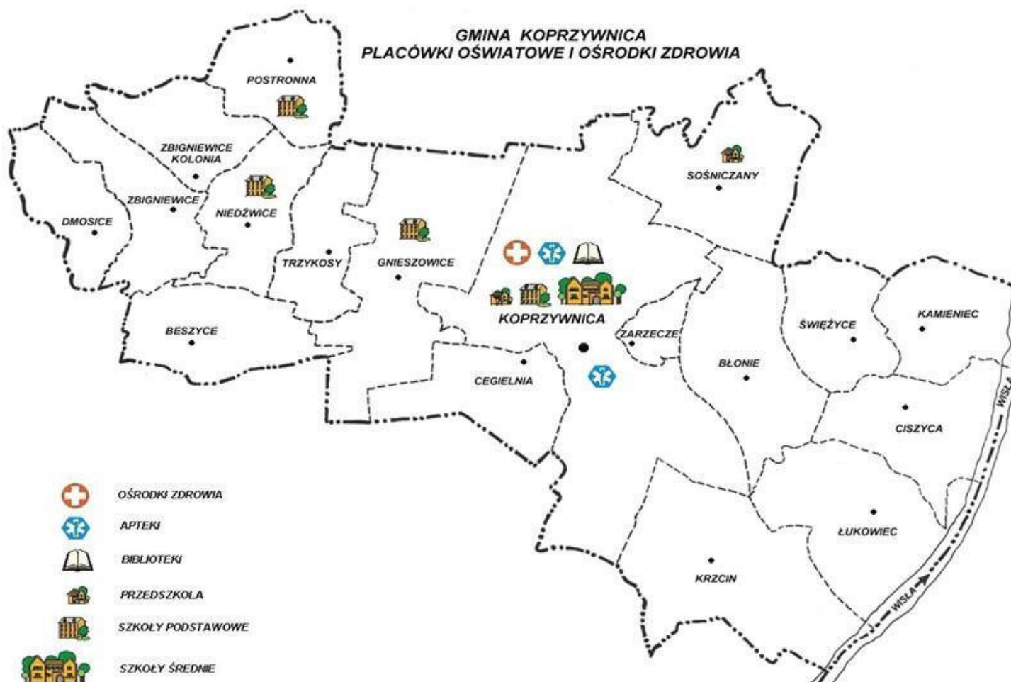
Mapa 1 Gmina Koprzywnica w podziale na sołectwa i osiedla

Siedzibą gminy jest miasto Koprzywnica. W latach 1975 – 1998 administracyjnie należała do województwa tarnobrzeskiego. W skład Gminy Koprzywnica wchodzi 15 sołectw, miasto Koprzywnica oraz dwa osiedla, zgodnie z poniższym wykazem: