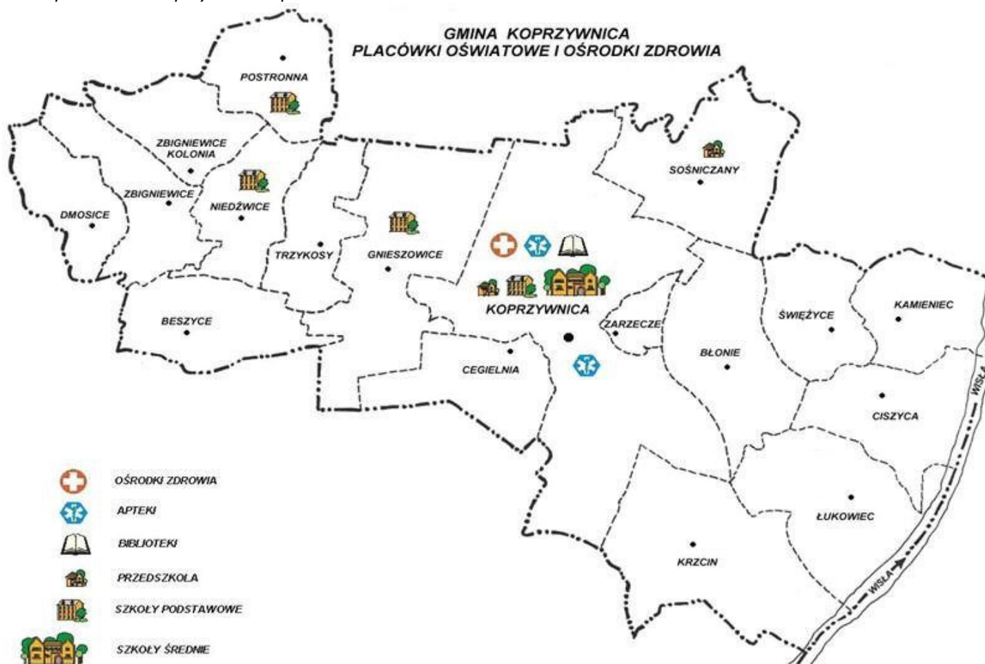
Mapa 1 Gmina Koprzywnica w podziale na sołectwa i osiedla

Koprzywnica jest gminą miejsko-wiejską położoną w województwie świętokrzyskim, w południowo - zachodniej części powiatu sandomierskiego. Historycznie znajduje się w Małopolsce, w ziemi sandomierskiej. Gmina położona jest przy drodze krajowej Kraków – Sandomierz na krawędzi doliny Wisły. Powierzchnia gminy wynosi około 6 935 ha, a samego miasta 1 788 ha. Gmina graniczy z trzema świętokrzyskimi gminami: Klimontów, Samborzec i Łonów oraz przez rzekę Wisłę (linia przechodzi środkiem rzeki) z Tarnobrzegiem i powiatem tarnobrzeskim woj. podkarpackiego.